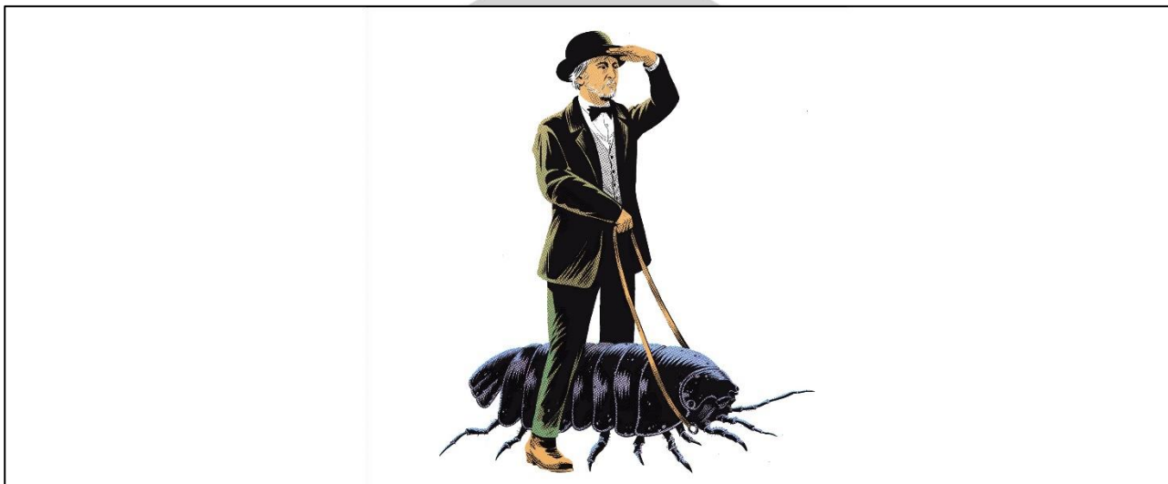
Album « Comme Kafka » © illustration Stéphane Oiry

ARNAUD LE GOUEFFLEC / MOCKE / CLAIRE GRUPALLO / ANTOINE MESAJER (FR)