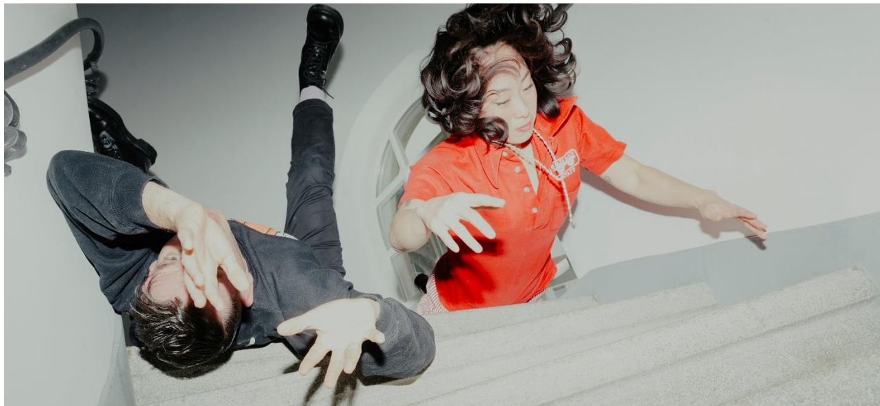
Xiu Xiu

14/16/18 euros (inclus dans le pass 2 jours à 30 euros et dans le pass 3 jours à 35 euros)