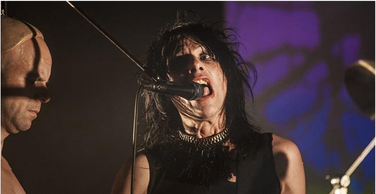
Les Tétines Noires

14/16/18 euros (inclus dans le pass 2 jours à 30 euros et dans le pass 3 jours à 35 euros)